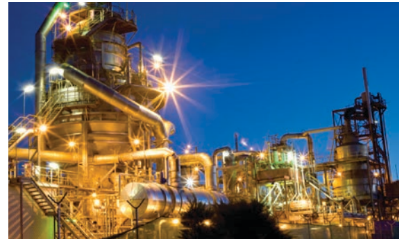
Petróleo y gas